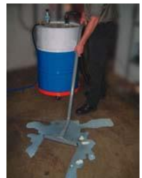
6296 Deluxe Drum Vac inkluderar en 6901 spillsugsats och fatkärra.