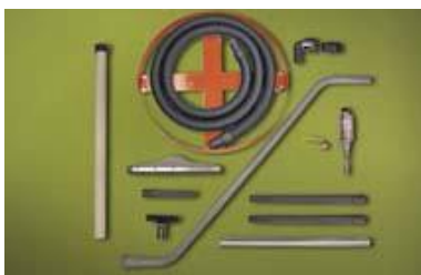
6296 Deluxe Drum Vac ingår dessutom fatkärra, spillsugsats och alla munstycken.