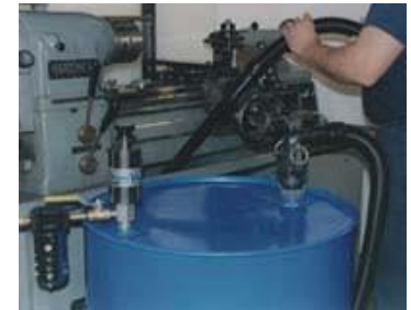
Model 6296 Reversible Drum Vac fills or empties machine sumps quickly and easily.

Varning: Drum Vac får inte användas för att pumpa vätskor med låg flampunkt eller lättantändliga vätskor som diesololja, sprit, lacknafta, bensin eller fotogen.