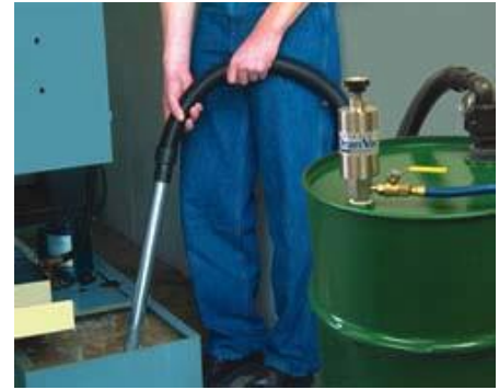
Drum Vac tömmer kylvätskesumpen i en CNC-maskin.