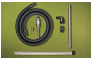
6196 Drum Vac inkluderar sugslang av plast och sugrör av aluminium.