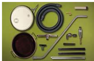
6196-5 Mini Drum Vac inkluderar en 20 lit hink med lock, golvsugsats, sugslang och tillbehör.